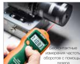
Бесконтактные измерения частоты оборотов с помощью лазера