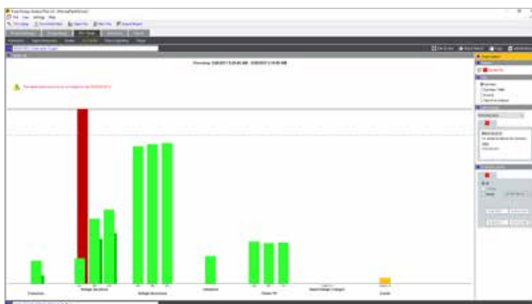
Fluke Energy Analyze Plus: Сводка по качеству электроэнергии