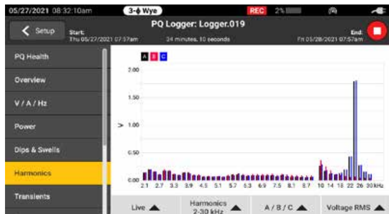
Полный диапазон гармоник доступен от первых 50 целочисленных гармоник и от 2 до 30 кГц

Приборы серии Fluke 1770 разработаны для обеспечения безопасности и простоты использования в любых условиях измерений. Приборы серии 1770 позволяют регистрировать полный спектр переменных качества электроэнергии, а также высокоскоростные формы сигналов, высокоскоростные переходные процессы и высокочастотные гармоники, которые моментально отображаются на большом экране с высоким разрешением. Благодаря самым высоким в своем классе номинальным значениям превышения напряжения CAT IV 600 В / CAT III 1000 В эти анализаторы могут использоваться на технологических входах или выходах, при измерении на входах переменного и постоянного тока, а также при измерении гармоник до 30 кГц. С анализаторами серии 1770 вы можете не сомневаться в том, что соберете все необходимые данные для выполнения самого эффективного технического обслуживания независимо от поставленной задачи.