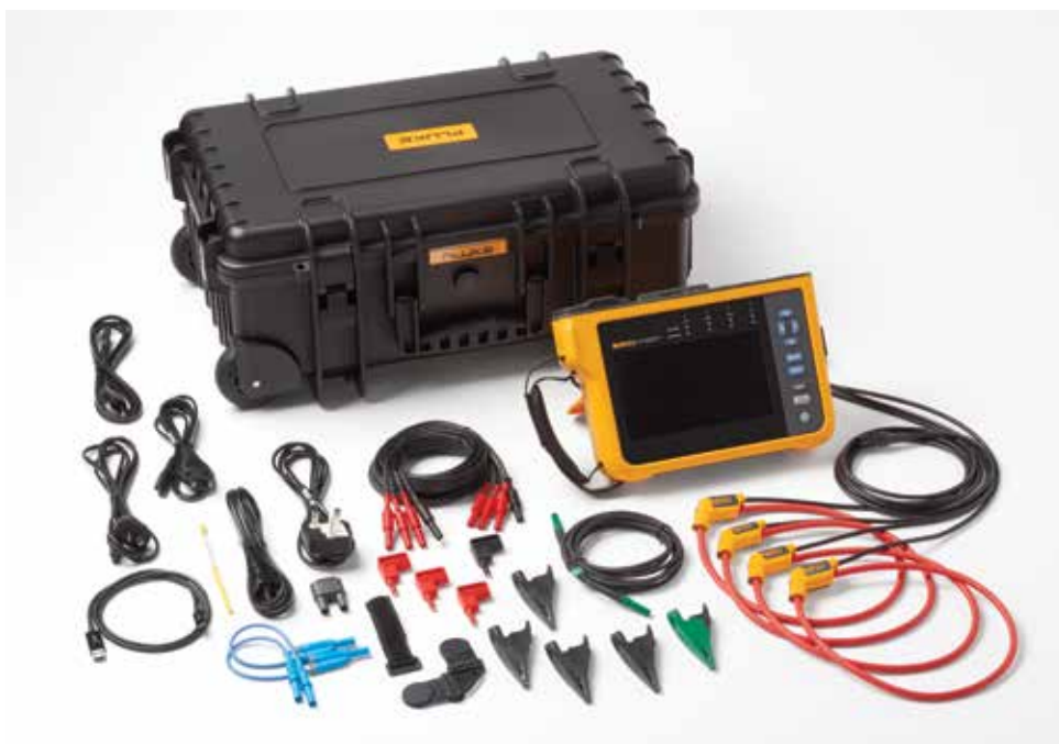
Анализатор качества электроэнергии Fluke 1777. Примечание. Состав комплекта поставки различается для каждой модели и перечисляется в таблице «Информация для заказа».