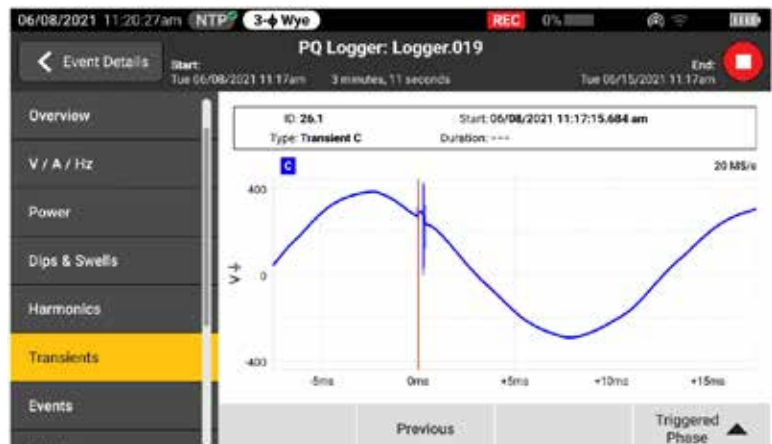
Отображение переходных событий напряжения в режиме реального времени при регистрации для ускоренной диагностики

Переходные процессы каждый день негативно влияют на состояние исправных систем, и не стоит недооценивать то, в какой мере они могут способствовать повреждению вашего оборудования. Независимо от того, какие переходные процессы наблюдаются в вашей системе — импульсные или колебательные, результаты их воздействия могут быть разрушительными и могут привести к возникновению различных проблем, начиная от повреждений изоляции до полного выхода оборудования из строя. В приборах Fluke 1775 и Fluke 1777 используется усовершенствованная технология регистрации переходных процессов, которая позволяет четко идентифицировать высокоскоростные переходные процессы и предоставляет данные, необходимые для их устранения. Частота получения данных анализатора качества электроэнергии Fluke 1775 составляет 1 МГц, благодаря чему осуществляется регистрация быстрых переходных процессов, а частота получения данных анализатора качества электроэнергии Fluke 1777 составляет 20 МГц, благодаря чему осуществляется регистрация самых быстрых переходных процессов с высокой степенью детализации.