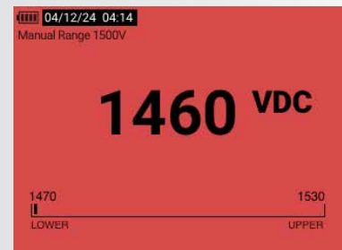
Jauge de limite : hors plage